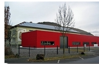
Wiesenweg 12-14, Bad Neuenahr-Heimersheim